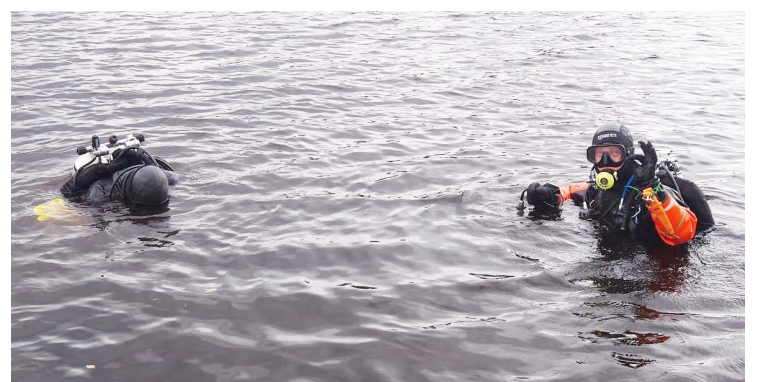
Rovaniemen Urheilusukeltajat siivosivat rantoja.

Hillatorin kupeeseen Saukonmäkeen on valmistunut uusi ympäristötaideteos Punos. Lapin yliopiston taiteiden tiedekunnan opiskelijoiden luoma teos pohjautuu Ranuan kunnan vaakunan virtaa kuvaavaan kuvioon, joka näkyy teoksen aaltoilevassa muodossa. Punos on osa Oulu2026/Ranua-kulttuuriohjelmää.