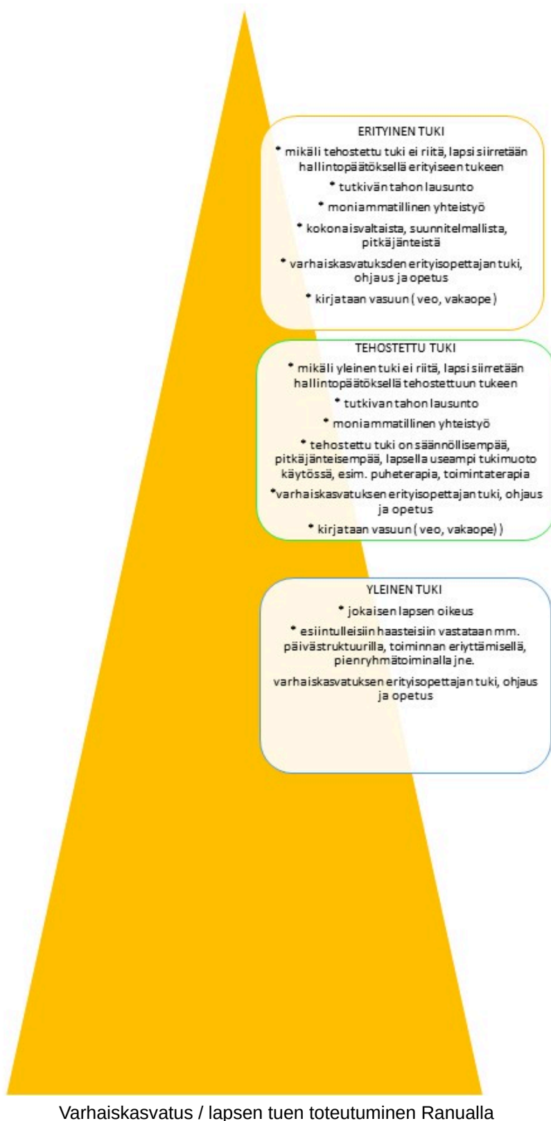
Varhaiskasvatus / lapsen tuen toteutuminen Ranualla

tuen taso voi myös muuttua ylös tai alaspäin